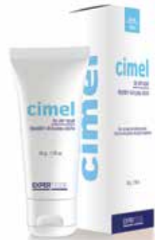
cimel™ DRY SKIN REPAIR