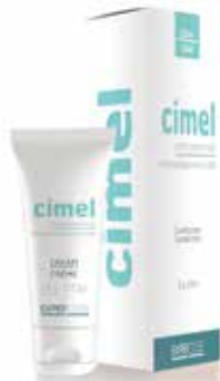
cimel™ CLARIFYING CREAM